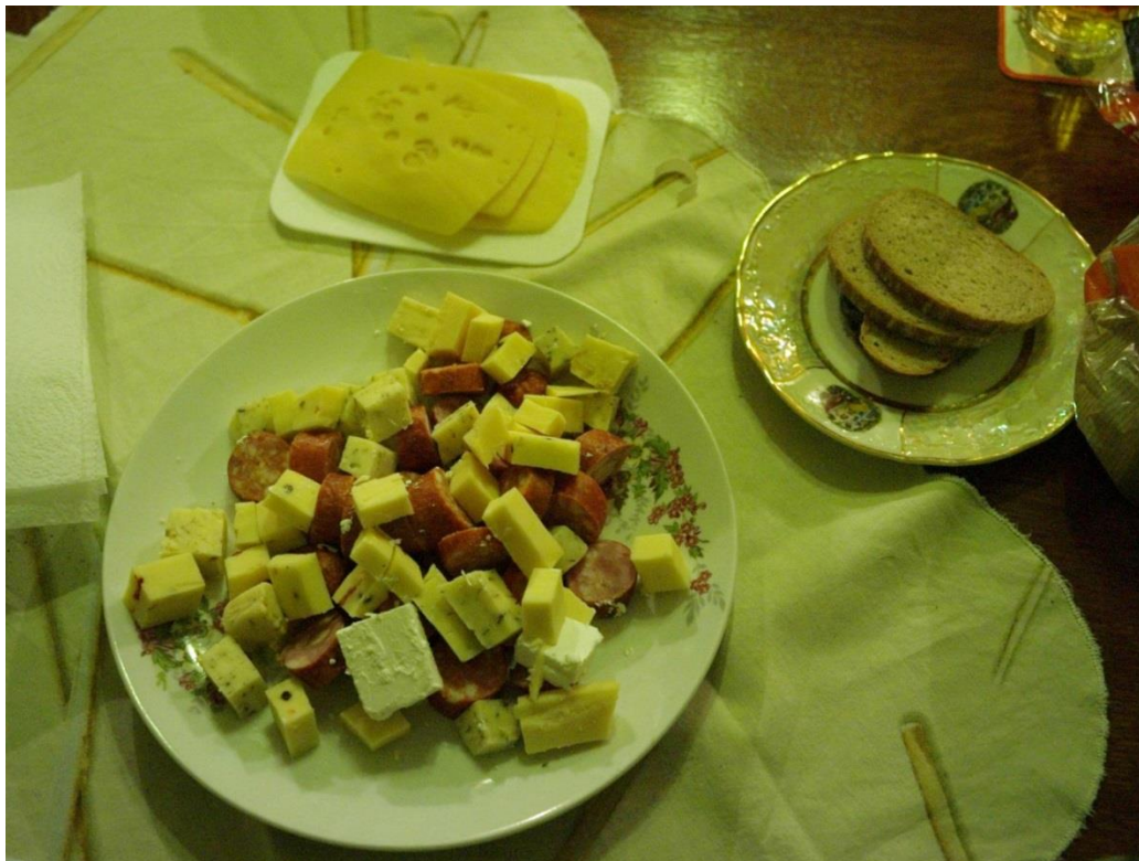
Ovšem hostina připravená Kačkou měla přece jen občas přednost.