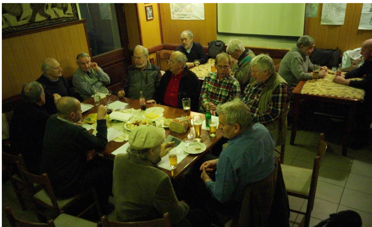
Takhle to na schůzce vypadalo ze shora.