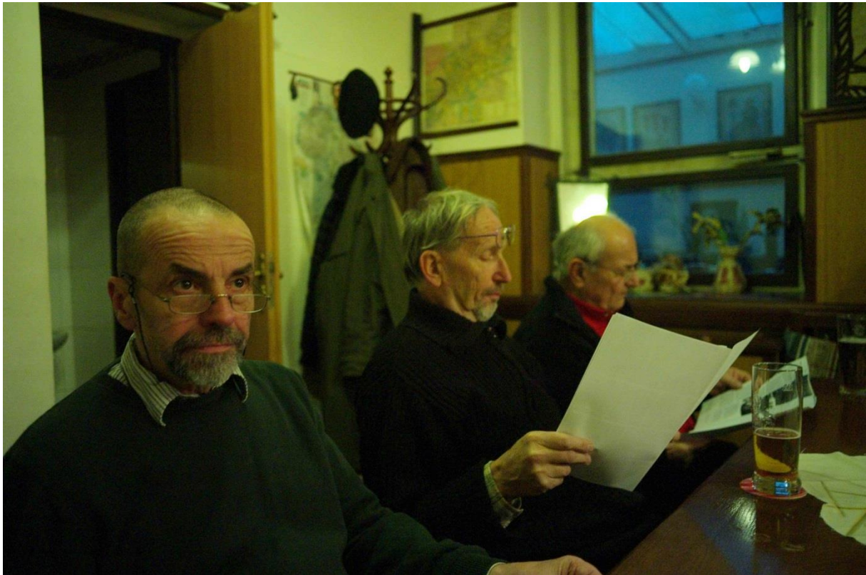
Přípravou detektivky jsme se začali všichni seriózně zabývat.