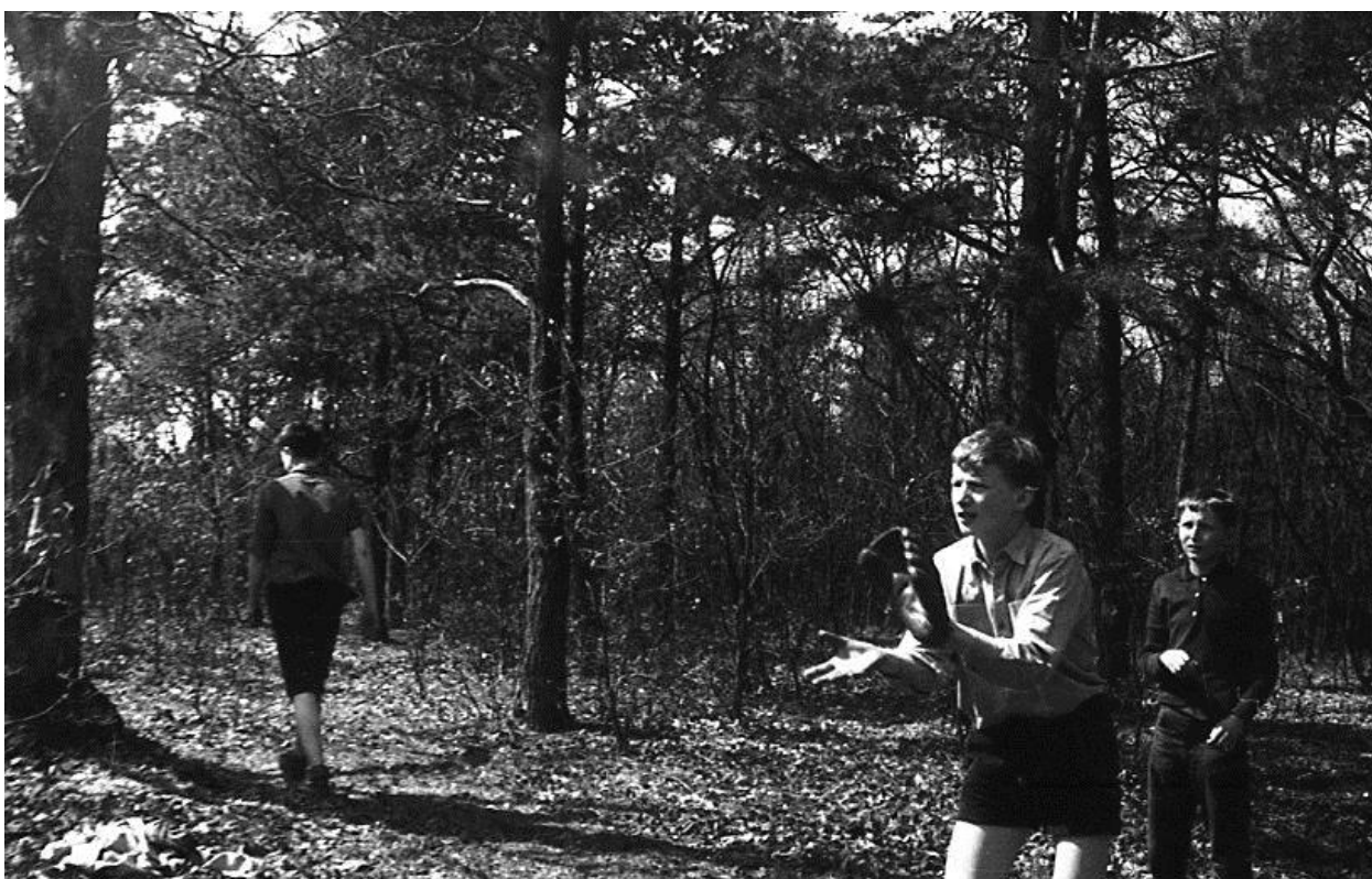
Pirilík co zadák (tehdy byla v oddíle jediná rukavice pro zadáka)