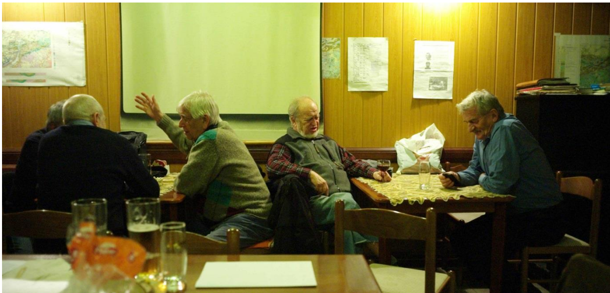
Částečně, jako obvykle, schůzka probíhala v kuloárech.