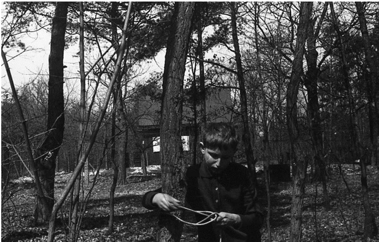
Job uzluje, možná na stejném výletě